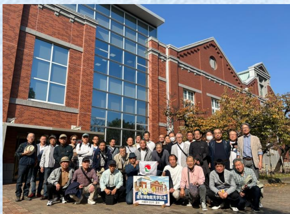
史跡めぐり（令和5年度）