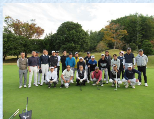
ゴルフクラブ（令和5年度）