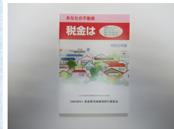
— あなたの不動産 税金は —