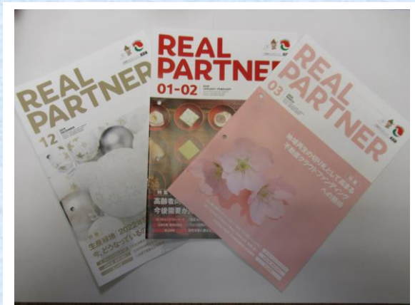
— リアルパートナー —