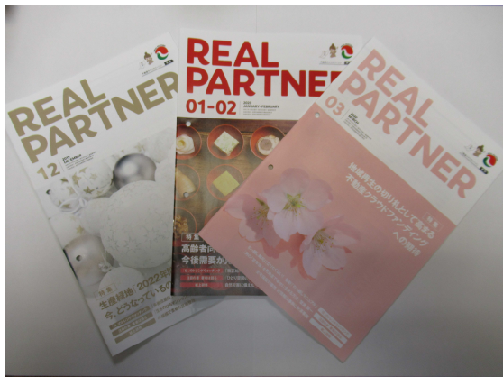
— リアルパートナー —