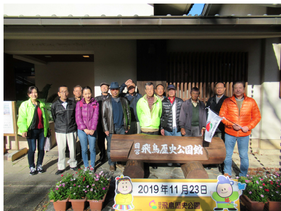
史跡めぐり（元年度）