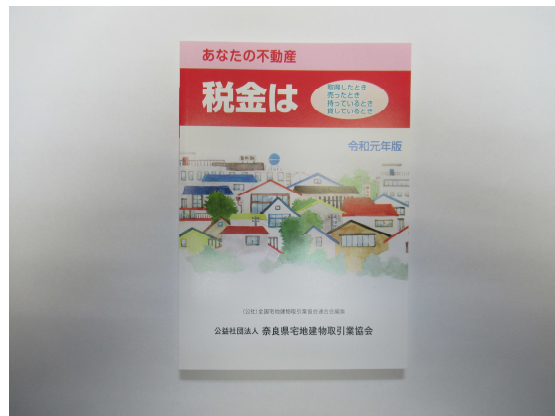
— あなたの不動産 税金は —