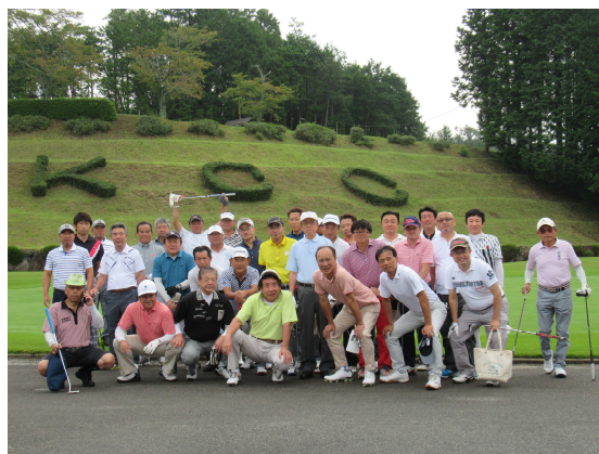
ゴルフクラブ（元年度）