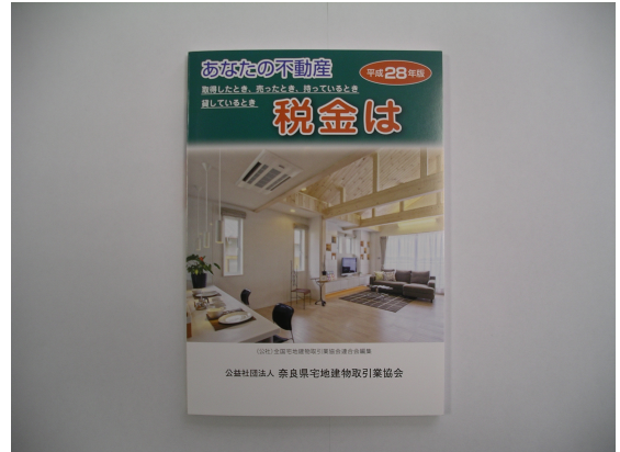
— あなたの不動産 税金は —