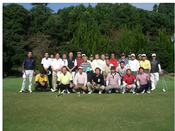
ゴルフクラブ（H28年度）