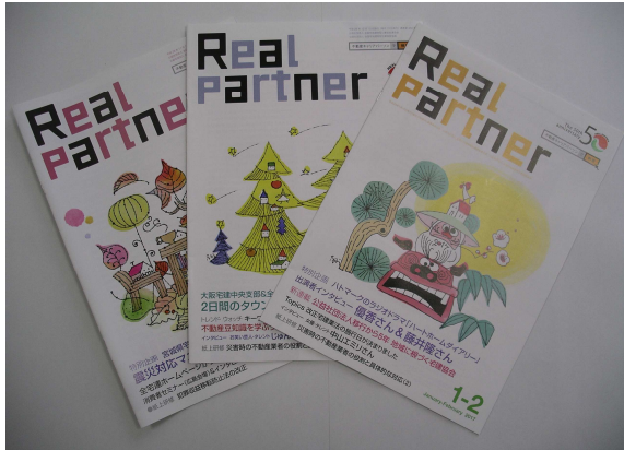
— リアルパートナー —