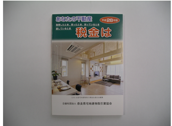
— あなたの不動産 税金は —